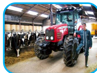
Nature & environnement