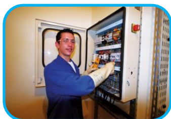
Industrie et Agro Alimentaire